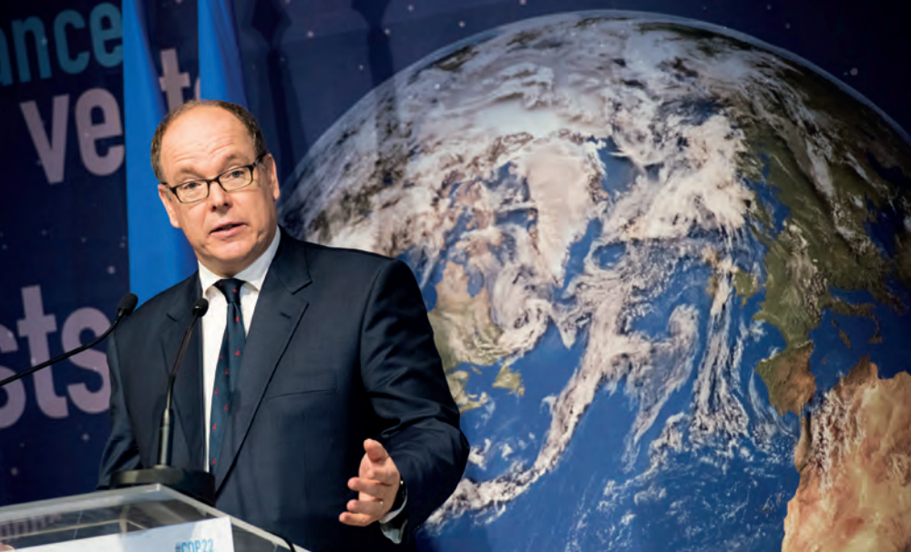
S.A.S. le Prince Albert II de Monaco à la COP 22 (Marrakech, Maroc), 12 novembre 2016