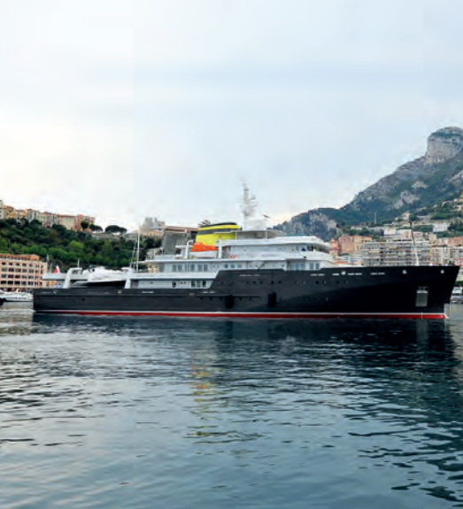
Le Yersin, navire écologique chargé des Explorations de Monaco