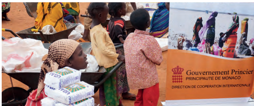
Aide humanitaire d'urgence : distribution alimentaire au Nord Kenya