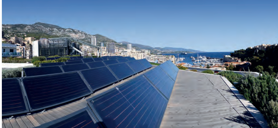
Panneaux solaires sur un immeuble domanial HQE