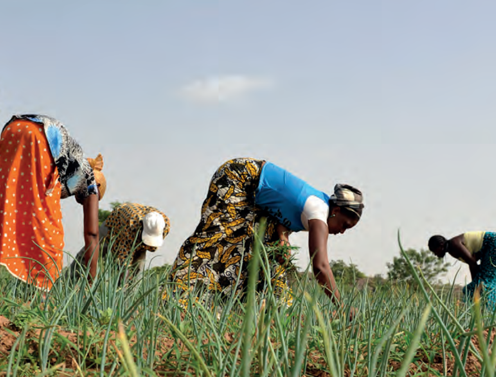
Soutien à l'agriculture familiale au Nord Mali