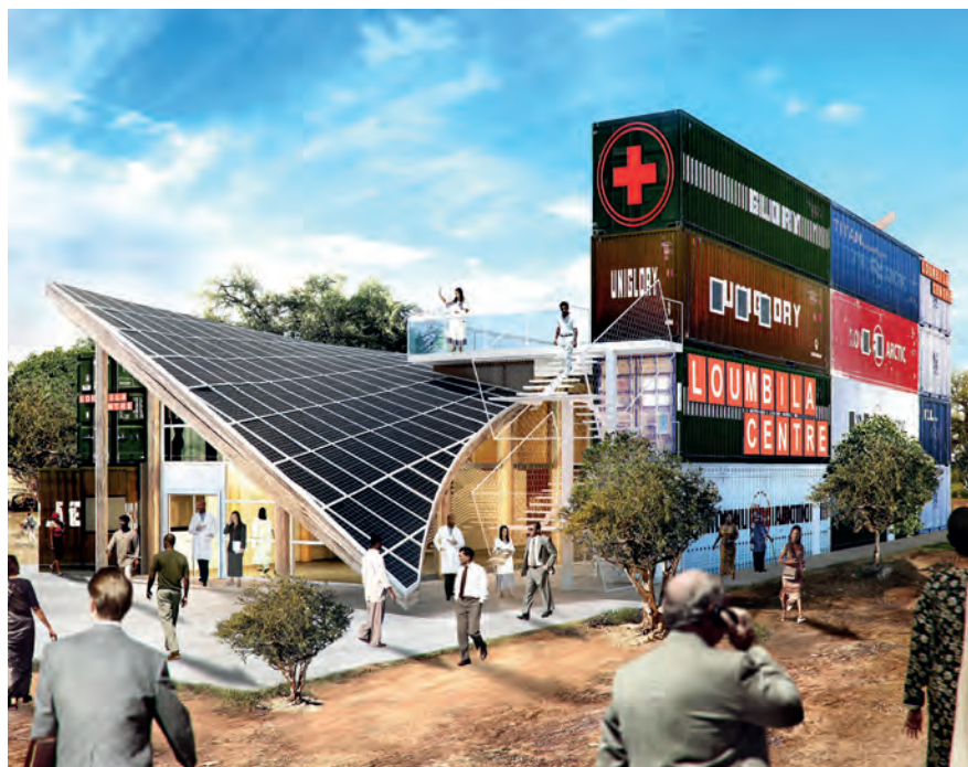
Futur centre de formation professionnelle de Loubila au Burkina Faso.

projet conçu en lien avec la Croix-Rouge Monégasque et la Croix-Rouge Burkinabé. Il inclura aussi un centre de formation à l'hôtellerie et à la restauration pour les jeunes en difficulté, de même qu'un centre d'enseignement au sauvetage aquatique financé par la Fondation Princesse Charlène de Monaco.