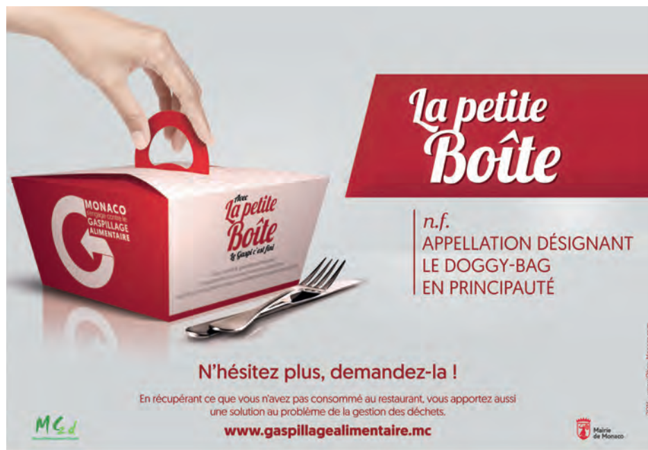
Campagne de la Mairie de Monaco et de l'association MC2D pour lutter contre le gaspillage alimentaire en Principauté

Afin de permettre aux femmes qui le souhaitent d'allaiter leur enfant, le service maternité de l'hôpital organise chaque semaine, un groupe de soutien à l'allaitement au travers duquel conseils et aides sont prodigués.