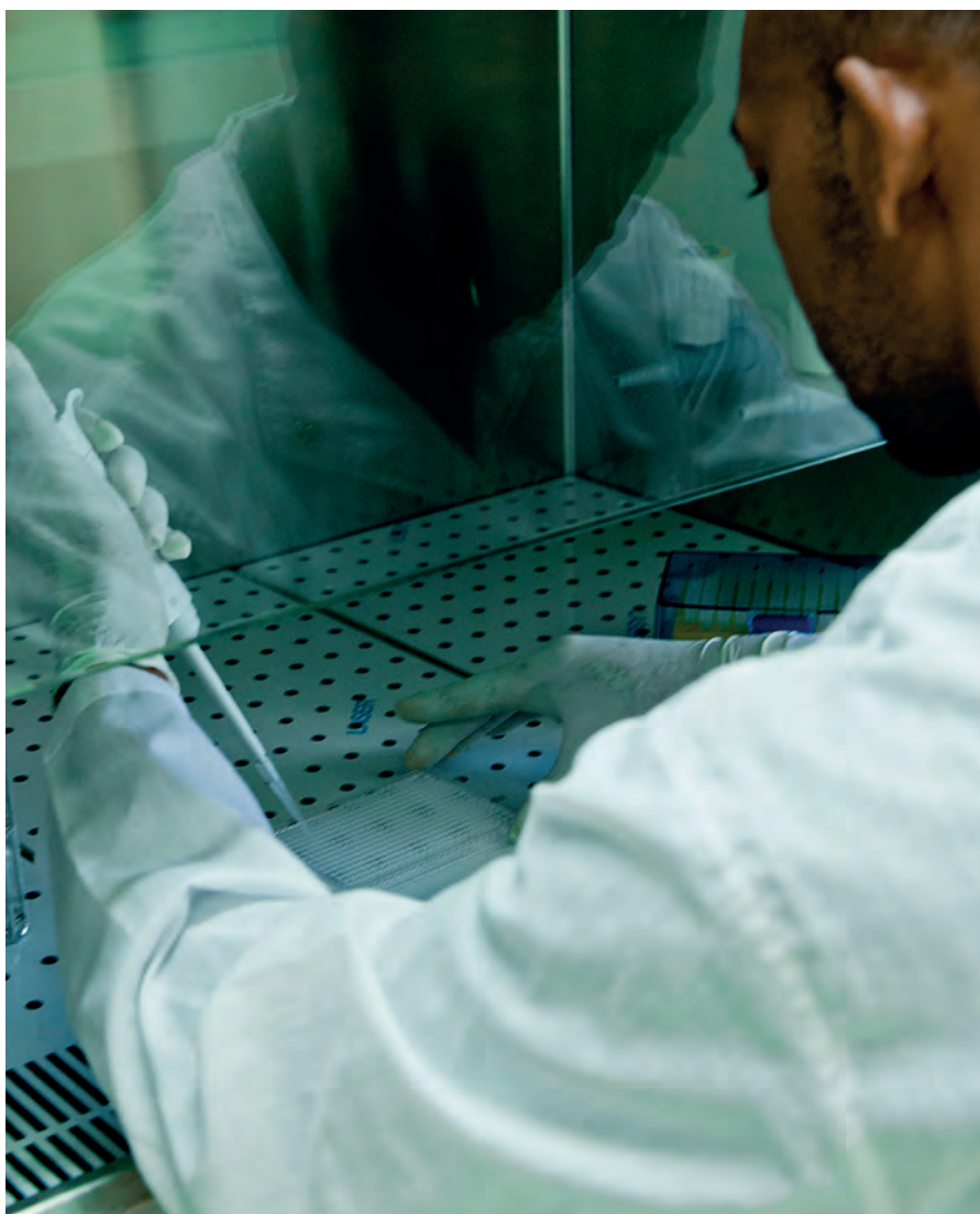
Renforcement des capacités médicales et scientifiques à Madagascar

S oucieuse de promouvoir un développement durable, juste et équilibré pour tous, la Principauté de Monaco consacre des efforts importants à l'Aide Publique au Développement (APD) : en 2020, son soutien financier atteindra plus de 500 euros par habitant. Ces aides ne pèsent pas sur l'endettement des pays en développement et sont totalement indépendantes de tout intérêt économique direct. Tous les projets soutenus le sont par ailleurs en respectant la souveraineté et l'autorité de chaque pays partenaire.