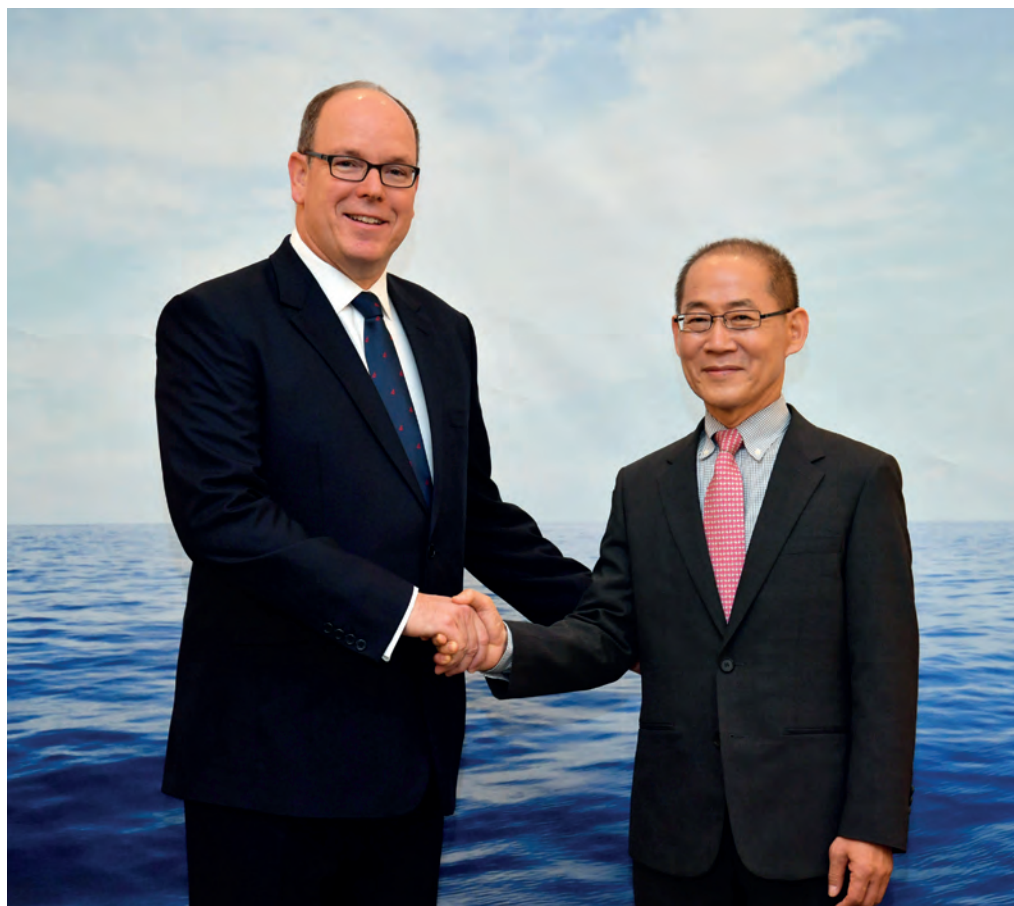
S.A.S. le Prince Albert II et M. Lee Hoesung, Président du GIEC lors de la réunion de cadrage du GIEC sur le rapport spécial « océans et cryosphère » à Monaco, 6 décembre 2016