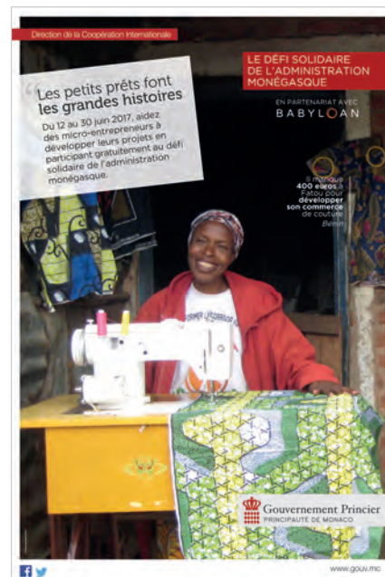
Le défi solidaire de l'Administration monégasque

Pour des raisons qui tiennent à l'histoire et à la géographie, la solidarité avec les pays de la rive Sud de la Méditerranée est particulièrement importante pour la Principauté.