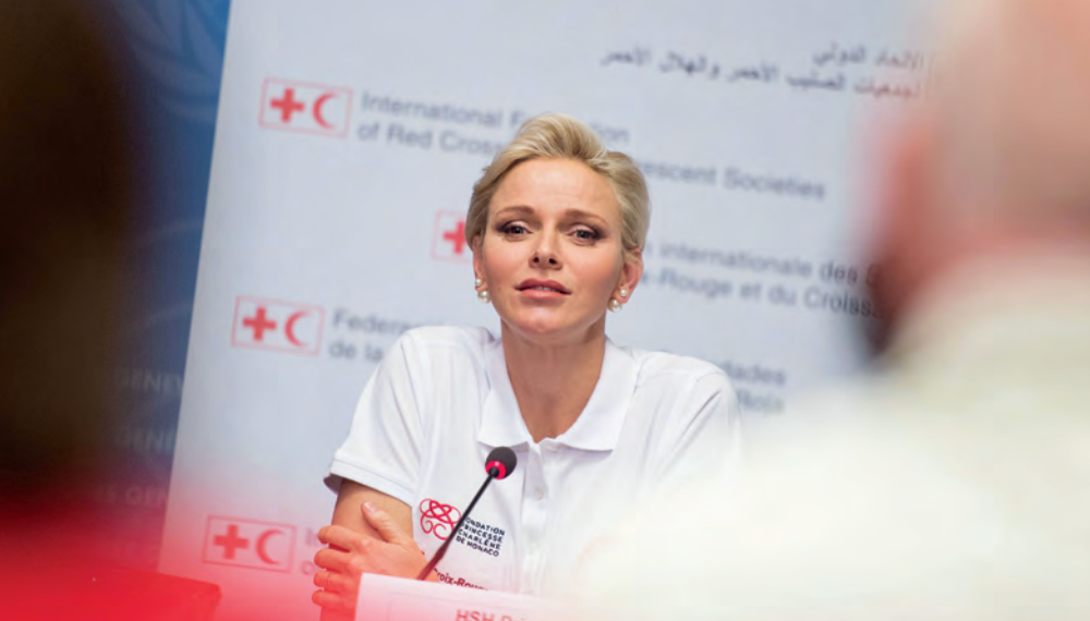
Participation de S.A.S. la Princesse Charlène de Monaco à la Journée mondiale des premiers secours organisée par la Fédération internationale des Sociétés de la Croix-Rouge et du Croissant-Rouge, Genève, Suisse, 9 septembre 2016