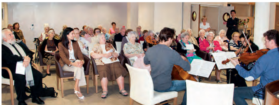
Concert de l'amitié par des musiciens de l'Orchestre Philharmonique de Monte-Carlo à la Résidence de retraite A Qietüdine

Afin de ne laisser personne de côté, les dispositifs d'aide et de soutien médicaux et sociaux agissent en relais, au travers de l'aide médicale de l'État, pour toute personne ne relevant pas d'un régime obligatoire de sécurité sociale et n'étant pas en mesure de souscrire une assurance auprès d'organismes privés. Le dispositif monégasque permet ainsi à l'ensemble de la population d'avoir accès à une couverture maladie.