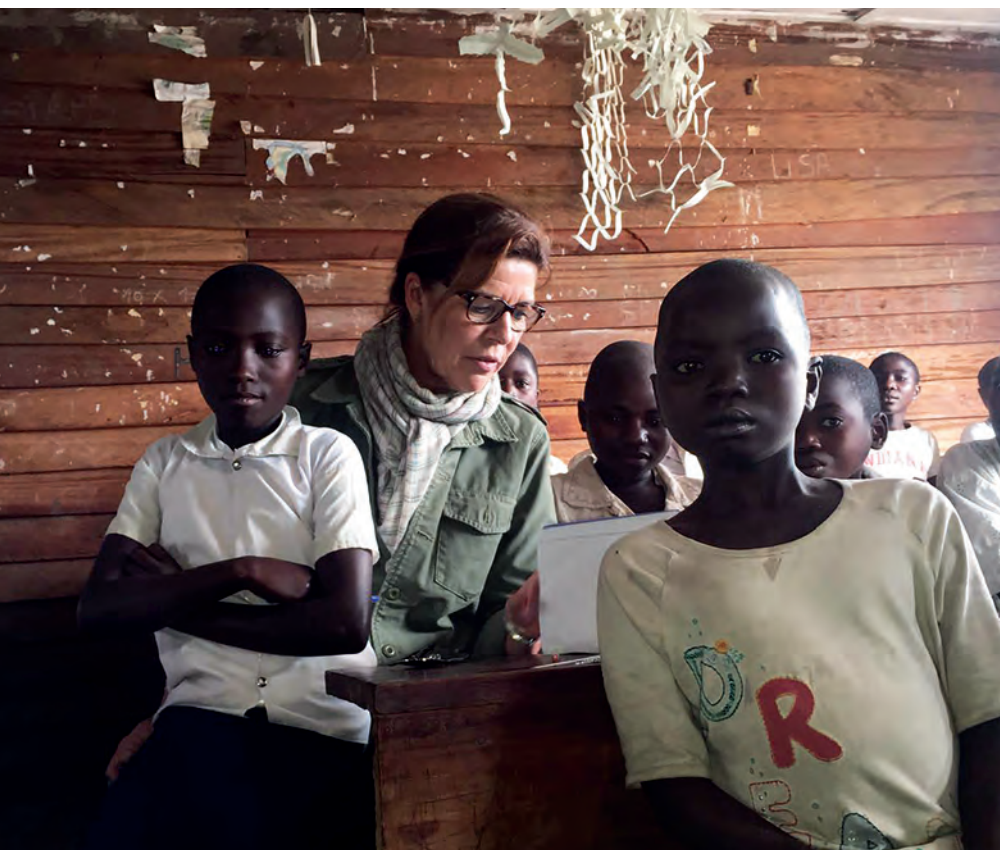
S.A.R. la Princesse Caroline de Monaco, Présidente de l'AMADE Mondiale, camp de déplacés internes de Mungote, Nord-Kivu, République Démocratique du Congo