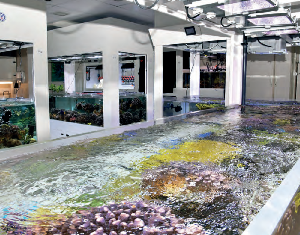
Salle des aquariums du Centre Scientifique de Monaco