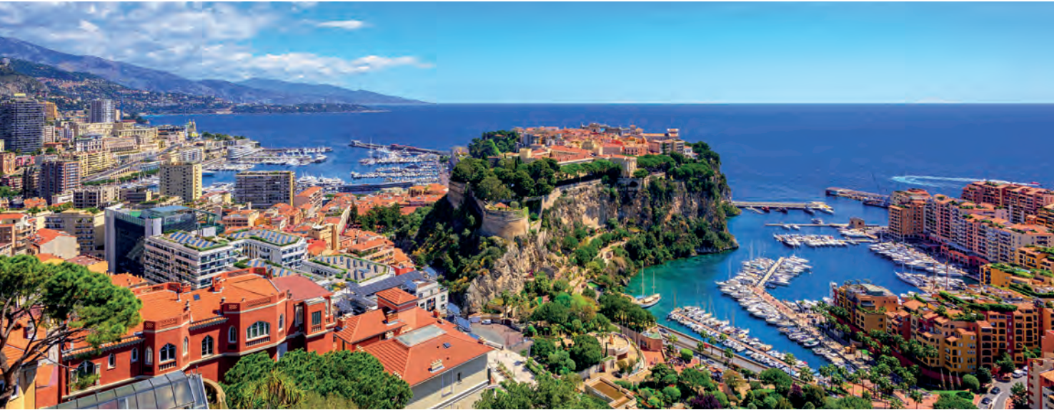
Principauté de Monaco