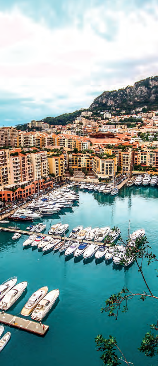
Monaco quartier de Fontvieille