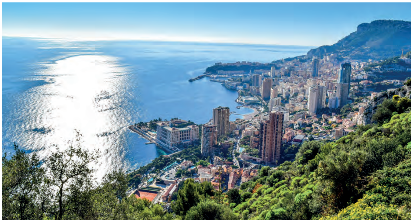
Principauté de Monaco

Un groupe de travail interministériel, placé sous l'autorité du Ministre d'État (Chef de Gouvernement) et piloté par le Département des Relations Extérieures et de la Coopération, a été créé, composé d'un référent de chaque Département ministériel.