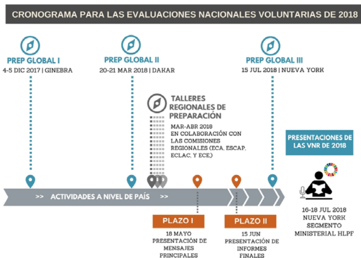
Figura 7: Cronograma para los exámenes nacionales voluntarios 2018 (DESA / DSD)

Los Informes ENV finales deben enviarse en formato electrónico a DESA antes del 15 de junio de 2018 (un mes antes del FPAN). Los exámenes finales se publican en línea. Es importante dejar tiempo para la aprobación nacional del examen y traducirla al inglés si así se desea. Los Informes ENV no son traducidas por la Secretaría, sino que se publican en el sitio web de FPAN en el / los idioma / s en que se envían.