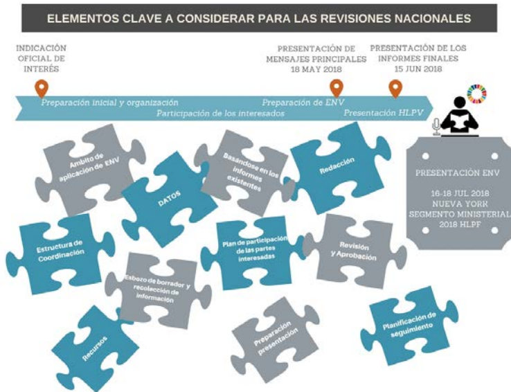
Figura 3: Elementos para la organización y preparación del examen

desde el gobierno y otras partes interesadas. Considerar establecer mecanismos para tratar problemas potencialmente polémicos.