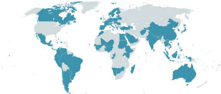
Figura 1: Mapa que muestra la distribución de los países ENV 2016-2018

Sesenta y cuatro países ya han realizado Exámenes nacionales voluntarios en el FPAN (22 países en 2016, y 43 países en 2017, con presentación de Togo en ambos foros). Sus ENV y los mensajes principales están disponibles en: https://sustainabledevelopment.un.org/hlpf . Cuarenta y siete países presentarán sus ENV en 2018.